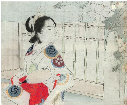
52. 水野年方 11. 傾城