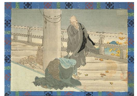
03. 小堀鞆音 1. 西行逢妻 サイズ 22.0×30.0 cm