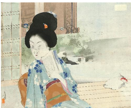
43. 水野年方 2. 簾影美人