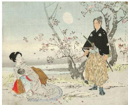
41. 三島蕉窓 3. 悪因縁