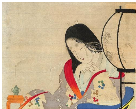
29. 富岡永洗 9. 妻の心