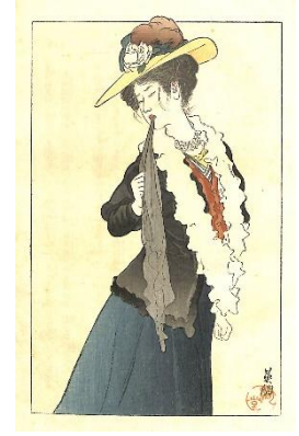
36. 鱒崎英朋 6. 生さぬなか下巻 2