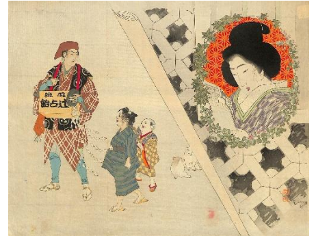
15. 武内桂舟 10. 風流辻占売