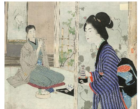
42. 水野年方 1. 鰻旦那