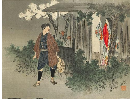
02. 小林永興 1. 縁外縁