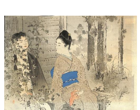
54. 水野年方 13. しのび音