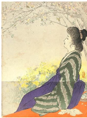
13. 武内桂舟 8. 花ぐもり サイズ 29.5×22.0 cm