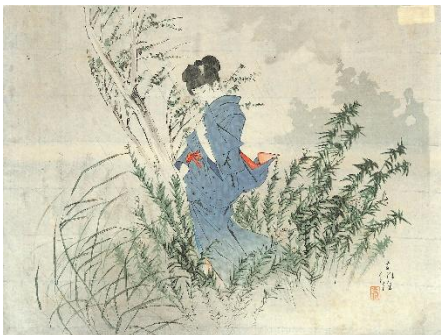
55. 山中古洞 1. 片時雨