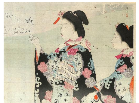
18. 寺崎広業 3. 花見