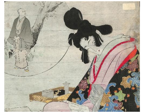
51. 水野年方 10. 吉野