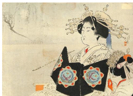
44. 水野年方 3. 濃艶美人