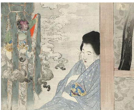
07. 武内桂舟 2. 梟物語