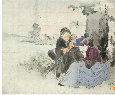
47. 水野年方 6. 湖畔の美人