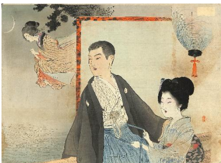
19. 寺崎広業 4. 夏歎秋恨