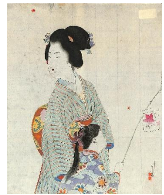
45. 水野年方 4. 新粧美人