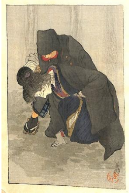
37. 鱒崎英朋 7. 生さぬなか後巻 1