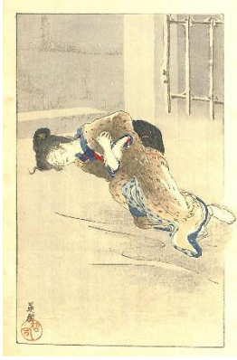
34. 鱒崎英朋 4. 生さぬなか中巻 2