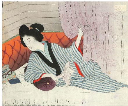
50. 水野年方 9. 船長の妻