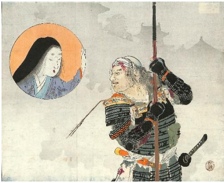
22. 富岡永洗 2. 勇士奮闘図