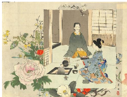
05. 鈴木華邨 2. 茶の湯と生け花 2