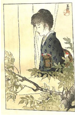
38. 鱒崎英朋 8. 生さぬなか後巻 2