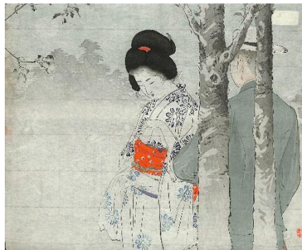
53. 水野年方 12. 愛の花束