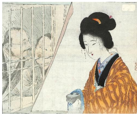
26. 富岡永洗 6. みだれ髪