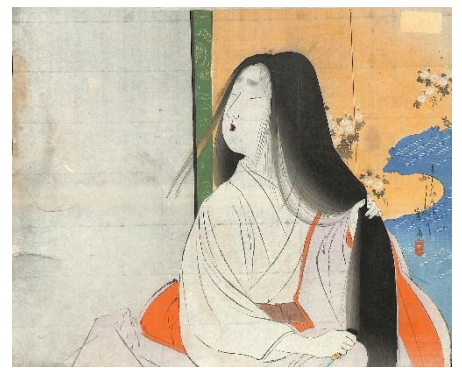
21. 富岡永洗 1. 袈裟御前