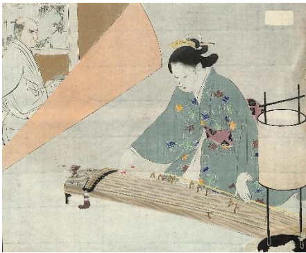
49. 水野年方 8. 曲翠