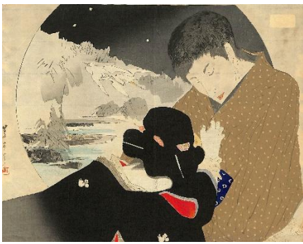
40. 三島蕉窓 2. 双々綺語図