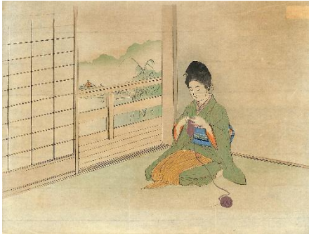
01. 梶田半古 1. 紅蓮白蓮 サイズ 22.5×29.5 cm