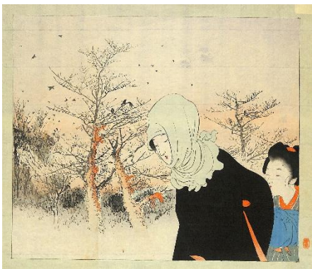
16. 寺崎広業 1. 枯林点紅