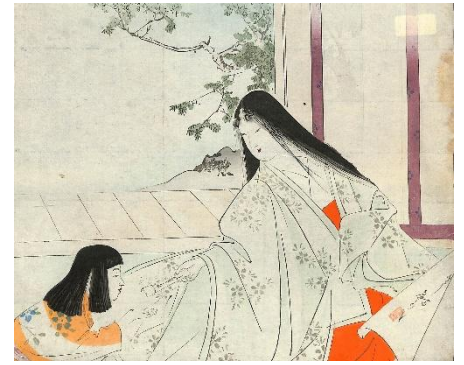
48. 水野年方 7. 五月女坂