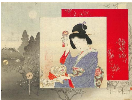
04. 鈴木華邨 1. 春艶佳麗