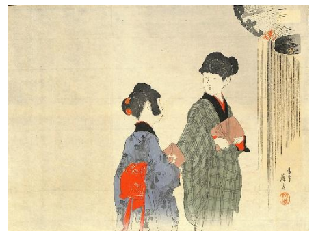
30. 富岡永洗 10. 声曲自在