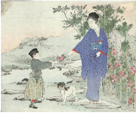
10. 武内桂舟 5. 薔薇荘