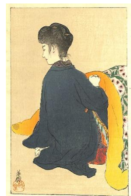
33. 鱧崎英朋 3. 生さぬなか中巻 1