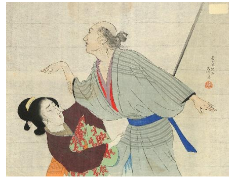
24. 富岡永洗 4. 椀久物語