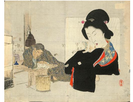
39. 三島蕉窓 1. われから