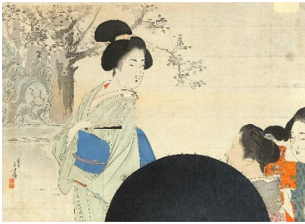
46. 水野年方 5. 紅辨白葩