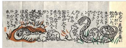
09.尻尾のない蛇 1980 年 10 月 11 日