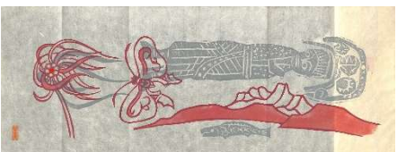
11.湖山 1981 年 10 月 24 日