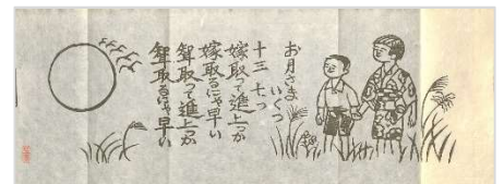
07.お月さいくつ 1979 年 10 月 28 日