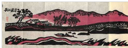
30. 長江風景 1992年11月7日