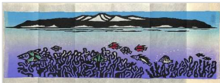
38.湖山「水中華」 1996年12月25日