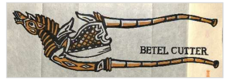
34.BETEL CUTTER 1994年11月13日