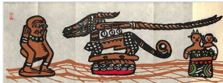
27. ブラック・アフリカ・アート 1991年4月27日