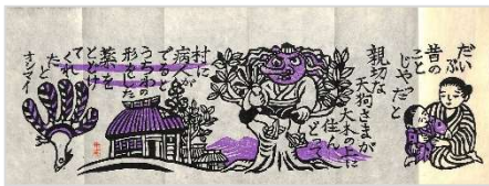
08.天狗さまの葉 1980 年 6 月 15 日