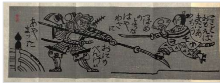
18. 絵ばなし(牛若殿・弁慶) 1985年10月19日