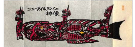
37.ニューアイルランドの神様 1996年4月13日