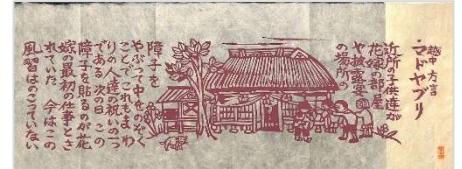
04.マドヤブリ 1978 年 5 月 21 日