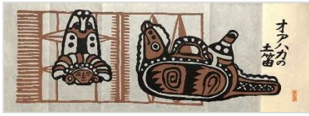
32.オアハカの土笛 1993年11月6日