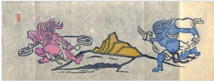
17. 湖山「風雷神の譚」 1985年5月25日