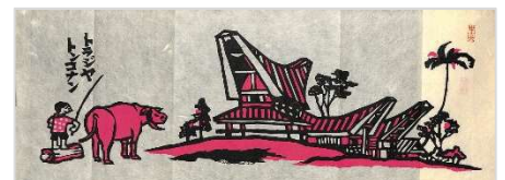
31. トラジャ・トンコナン 1993年5月22日