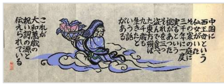
21. 大和萬歳長生桃 1987年5月23日