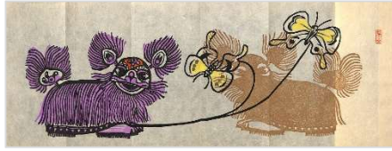
15. 唐獅子・蝶 1984年3月20日