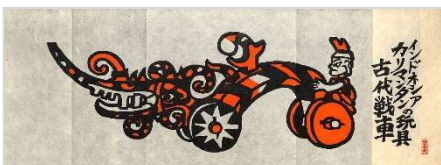
29. カリマンタンの玩具古代戦車 1992年5月23日