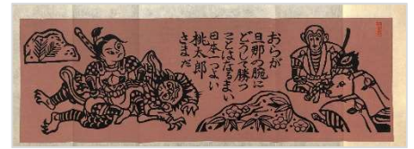
19. 日本一桃太郎 1986年5月24日