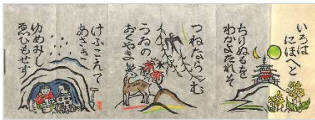
02.いろは歌 1977 年 6 月 12 日