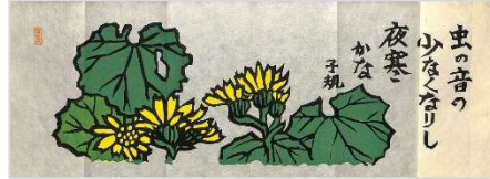
36.子規句虫の音の 1995年11月11日