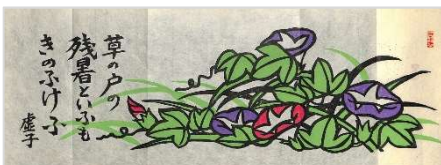
26. 虚子句残暑 1989年8月25日