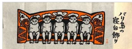
39.バリ島の寝台飾り 1997年6月14日