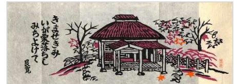
28. 良寛の句きませきみ 1991年11月9日