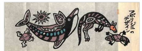
40.アボリジニのデザイン 1997年10月25日