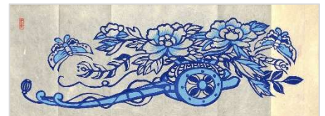
25. 花車 1989年6月3日