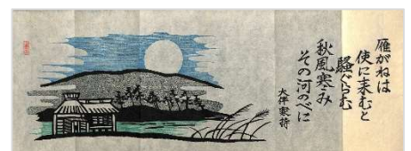
13.越中萬葉「雁」1982 年 10 月 11 日