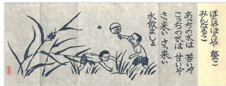
06.蛭こ 1979 年 6 月 17 日