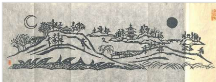
05. 日月 1978 年 10 月 9 日