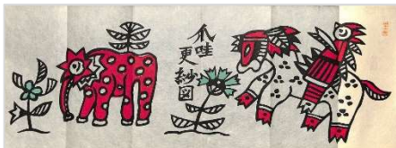
41.ジャワ更紗図 1998年8月10日