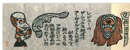
12.彫刻美術品 1982 年 6 月 5 日