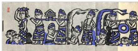
24. インドネシア海のお祭り 1988年11月4日