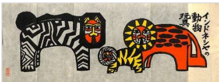
23. インドネシア動物玩具 1988年6月11日