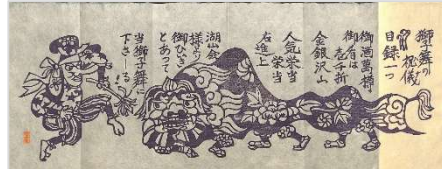
03.獅子舞のハナ 1977 年 10 月 13 日