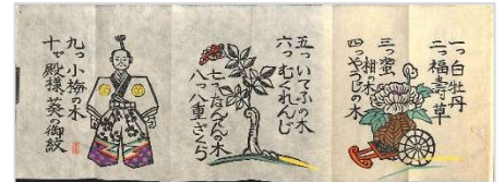
01.数えうた 16.6×45.5 cm 1976 年 10 月 11 日刊行