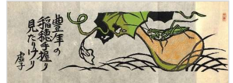
22. 虚子句豊年 1987年10月3日