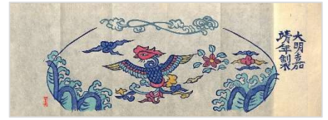
16. 中国赤絵 1984年10月13日