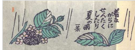
33.一茶句夏の雨 1994年6月11日