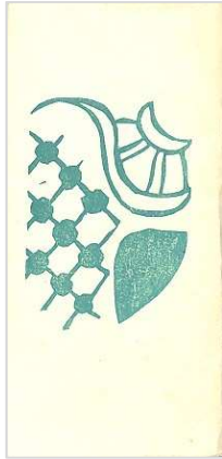
00-1.表紙 17.0×8.2 cm

全 42 冊 1976 年～2000 年まで 限定 100 部～180 部 一枚の板目木版画を六折して小冊子にした。