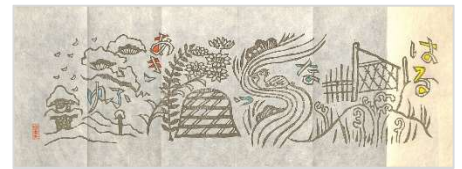
10.春夏秋冬 1981 年 6 月 13 日