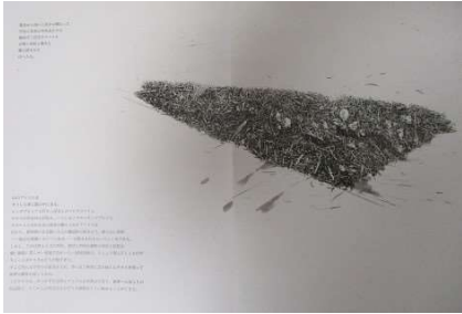
01. 両界への出入り サイズ 42.0×59.4 cm