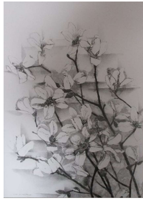
02. 花と頁に サイズ 42.0×29.7 cm