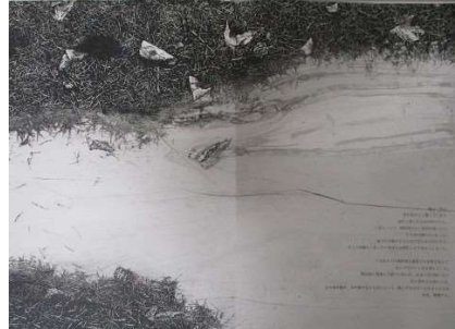
05. 冷たい II