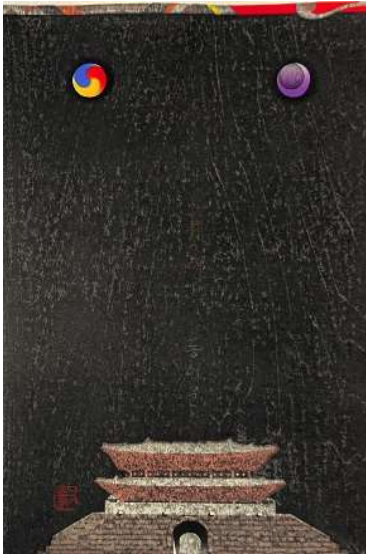
01. 東大門 ペーパーサイズ 58.0×42.0 cm イメージサイズ 46.0×32.0 cm