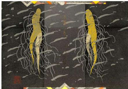
04. 高麗人參 32.0×46.0 cm