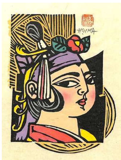
07. 舞姫 イメージサイズ 15.0 × 12.0 cm