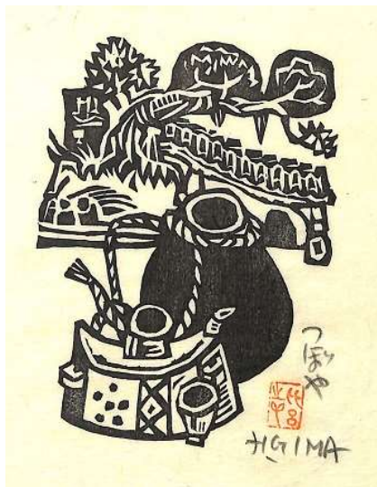
02. 壺屋 イメージサイズ 13.0 × 9.5 cm