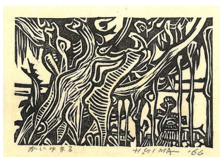
05. がじゅまる イメージサイズ 9.5 × 15.0 cm