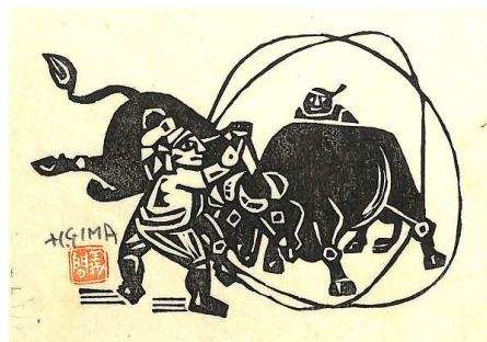
04. 闘牛 イメージサイズ 9.5 × 14.0 cm