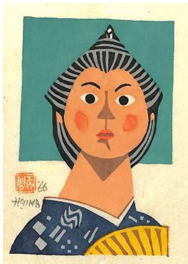
01. 琉球まげの女 ペーパーサイズ 21.0 × 15.5 cm イメージサイズ 14.8 × 10.0 cm