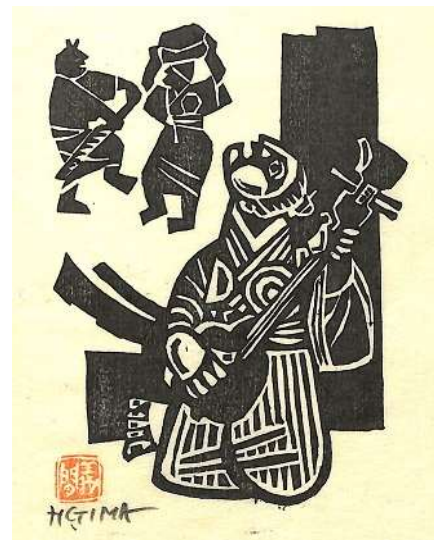
03. 三味線 イメージサイズ 13.0 × 9.0 cm