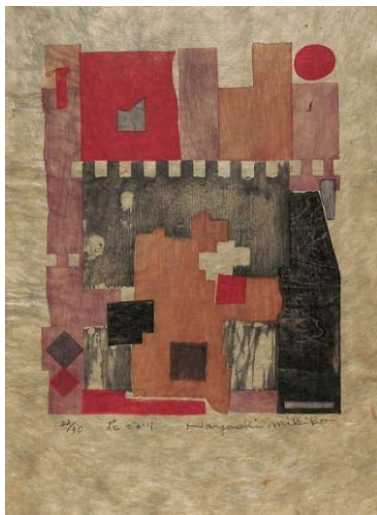
5.花かざり(ブータン紙) イメージサイズ 23.5×19.0 cm