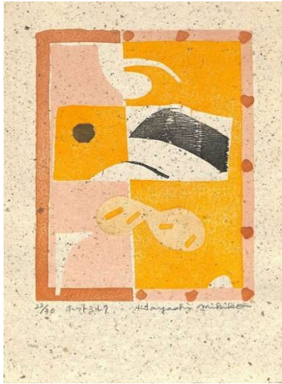
1.ホットミルク(インド綿紙) ペーパーサイズ 33.2×24.3 cm イメージサイズ 23.5×18.8 cm