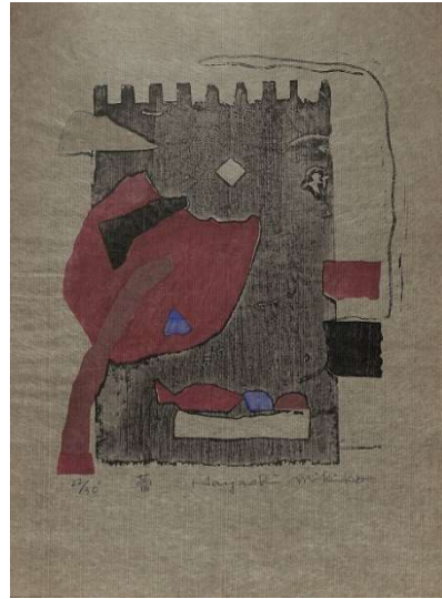
2.雷(三極紙栗染) イメージサイズ 23.5×20.0 cm