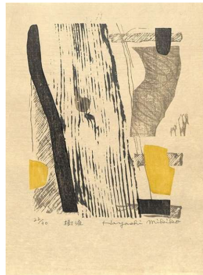
4.樹液(土佐三極板干) イメージサイズ 23.5×19.5 cm